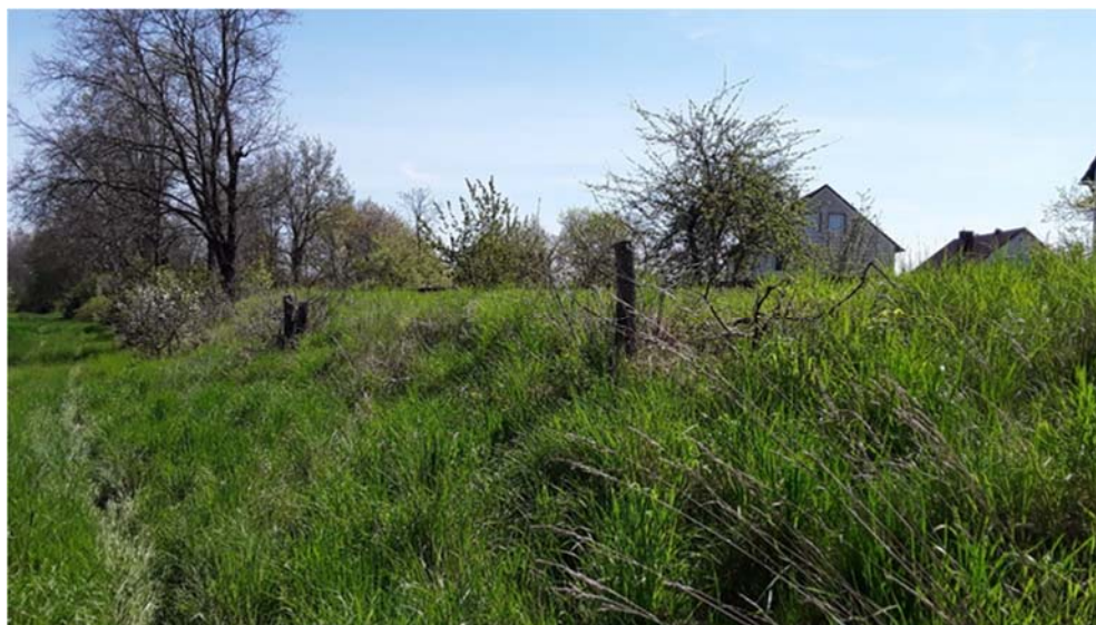
Abbildung 2: Bahndamm im Bereich des zukünftigen Bahnhofes