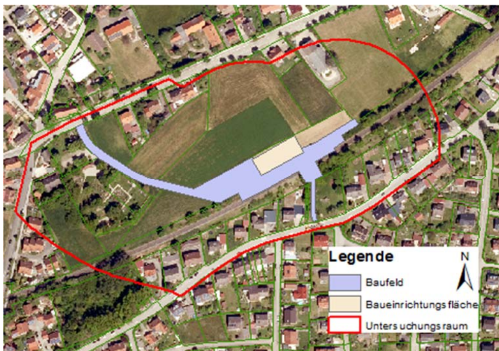
Abbildung 1: Untersuchungsraum des Vorhabens